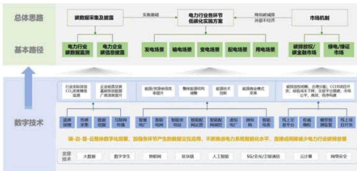
图 3：数字技术助力电力行业低碳化发展基本路径

配用的全环节中落实低碳化实施方案，第三是通过碳排放权交易和绿电、绿证市场，降低企业因碳排放产生的额外成本，提升企业主动降低碳排放的意愿。